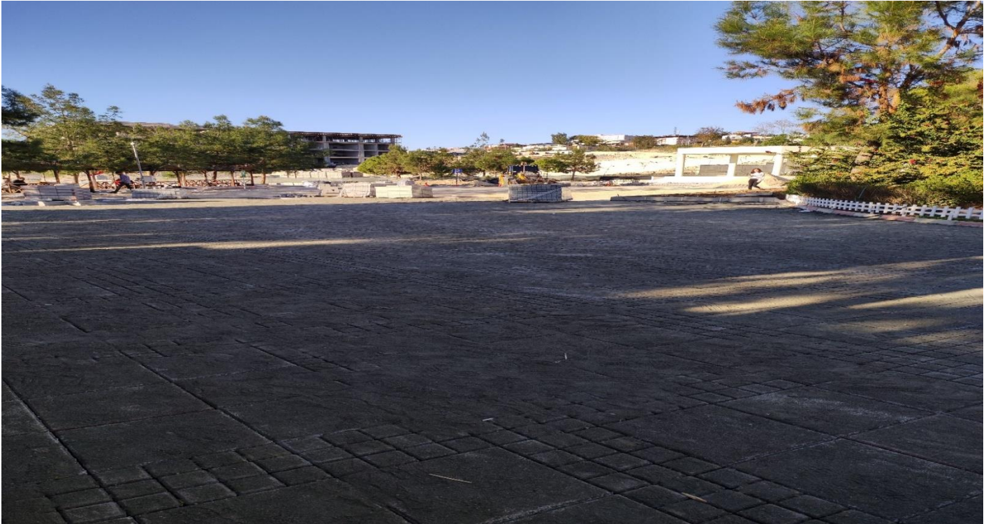
Tarsus Üniversitesi Çevre Düzenleme ve Yol Aydınlatma Yapılması İşi