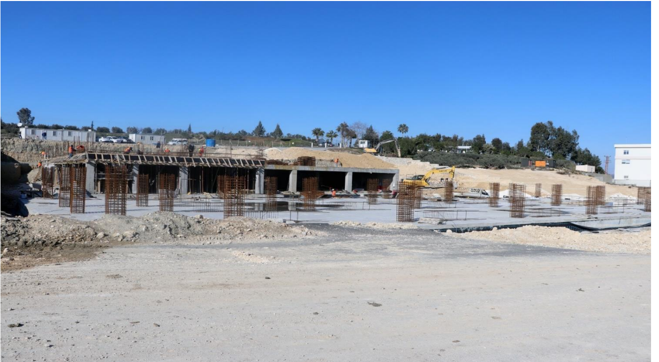
Tarsus Üniversitesi Mühendislik Fakültesi Yapım İşi