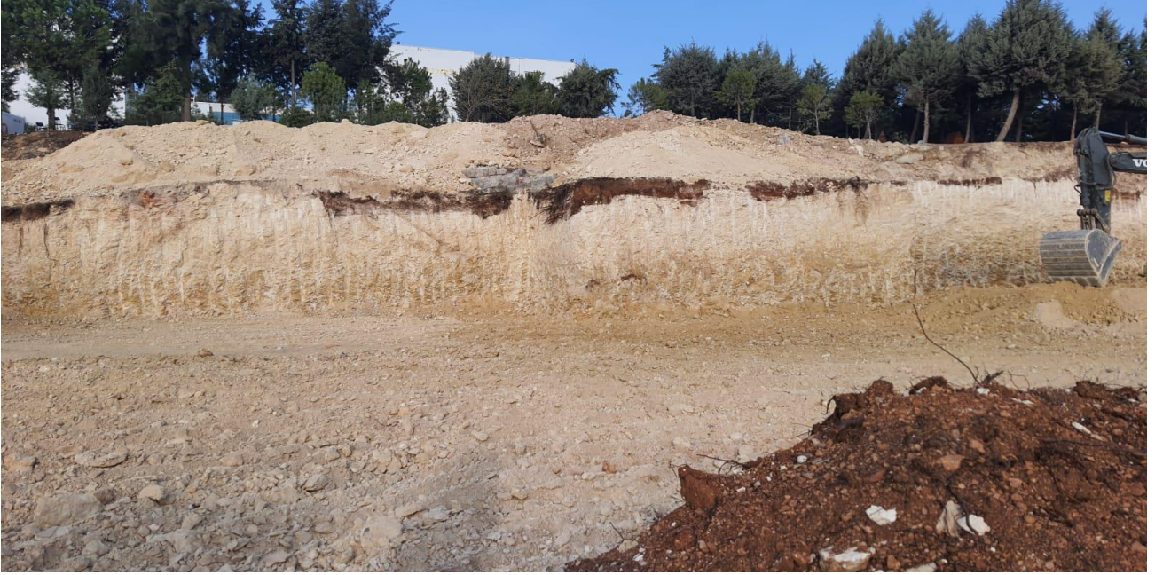
Tarsus Üniversitesi Yabancı Diller Hazırlık Sınıfları Derslik Binası Yapım İşı

Üniversitemiz kuzey yerleşkesinde 18.11.2022 tarihinde yapımına başlanan Tarsus Üniversitesi Yabancı Diller Hazırlık Sınıfları Derslik Binası Yapım İşinin sözleşme bedeli 38.880,00 TL. Yapım işinin % 7'si tamamlanmıştır.