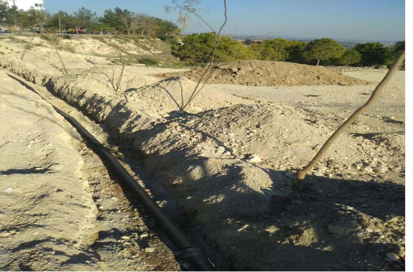
Tarsus Üniversitesi Çevre Düzenleme ve Yol Aydınlatma Yapılması İŖi