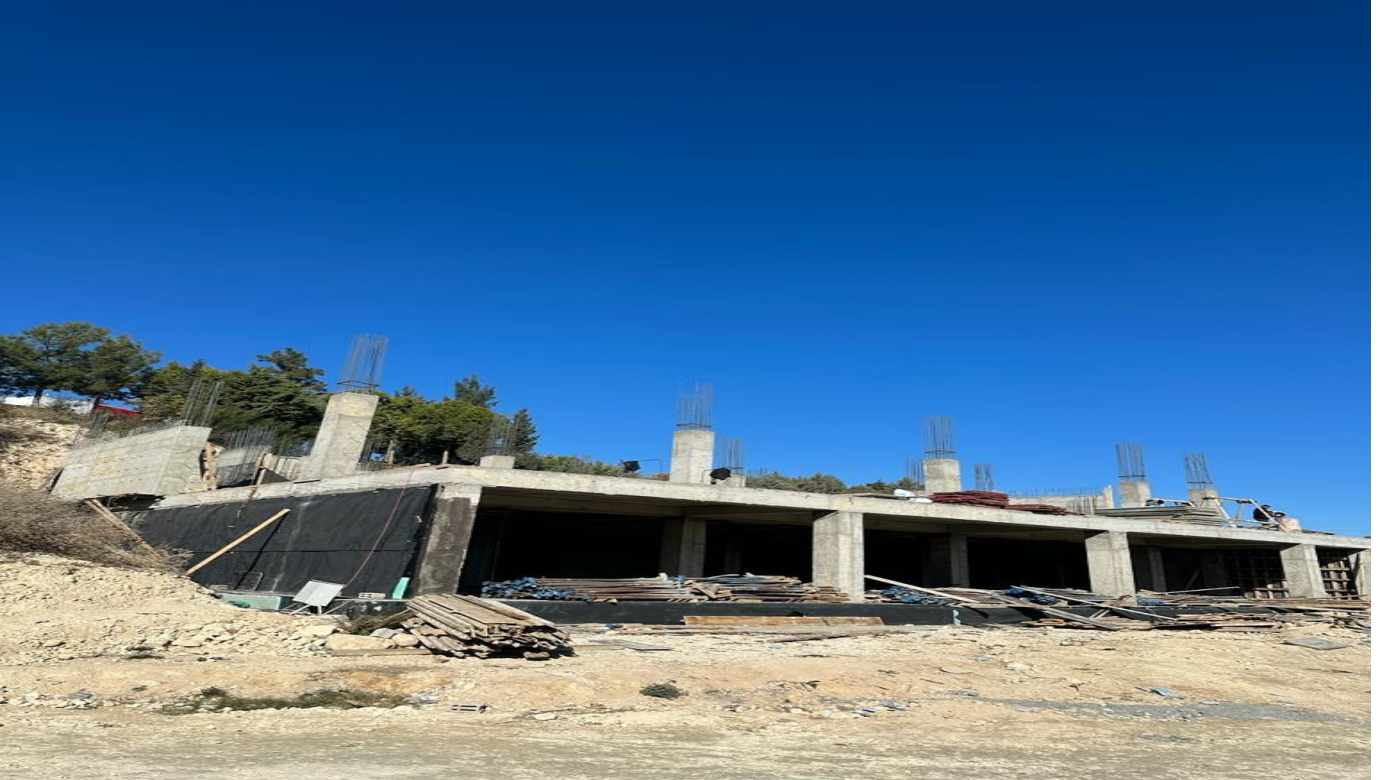
Tarsus Üniversitesi Yabancı Diller Hazırlık Sınıfları Derslik Binası Yapım İşi