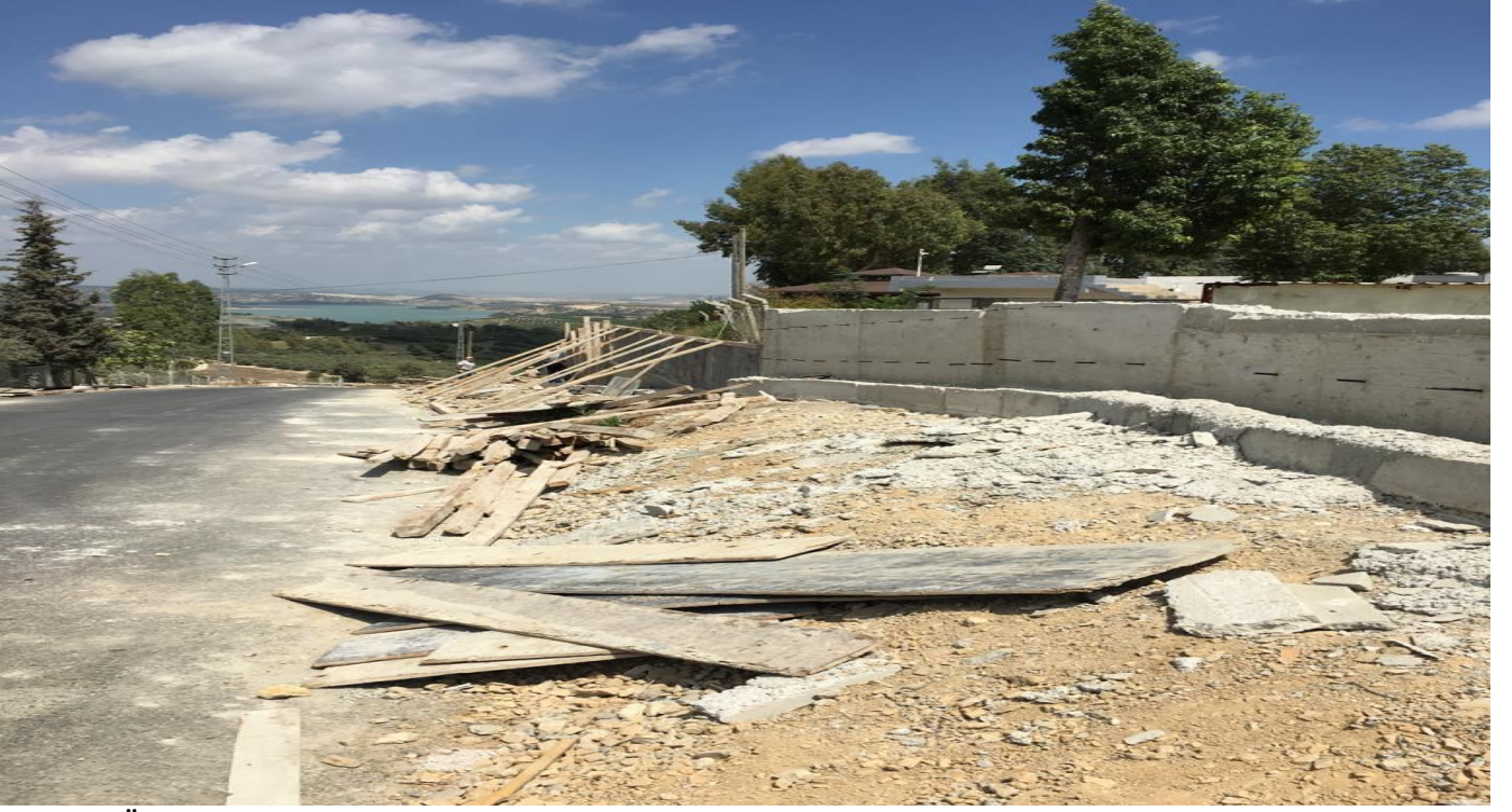
Tarsus Üniversitesi Çevre Duvarı ve Giriş Kapısı Yapılması