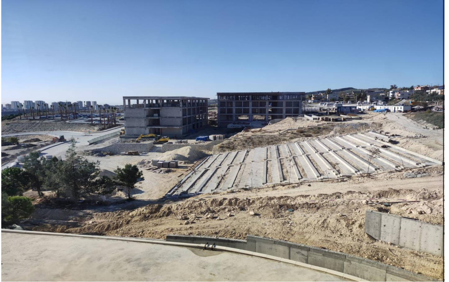
Tarsus Üniversitesi Mühendislik Fakültesi Yapım İşi