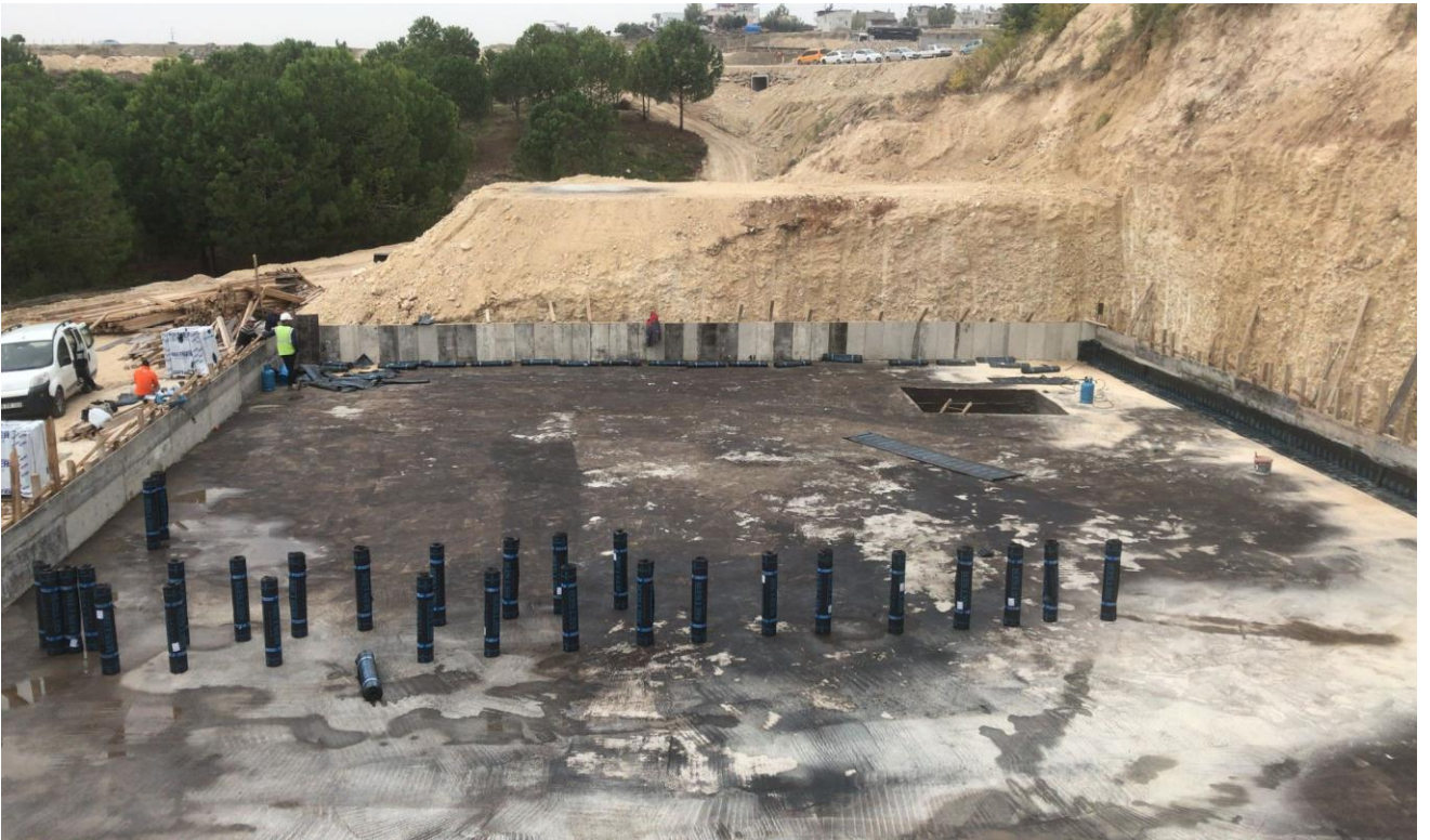
Tarsus Üniversitesi Yabancı Diller Hazırlık Sınıfları Derslik Binası Yapım İşı