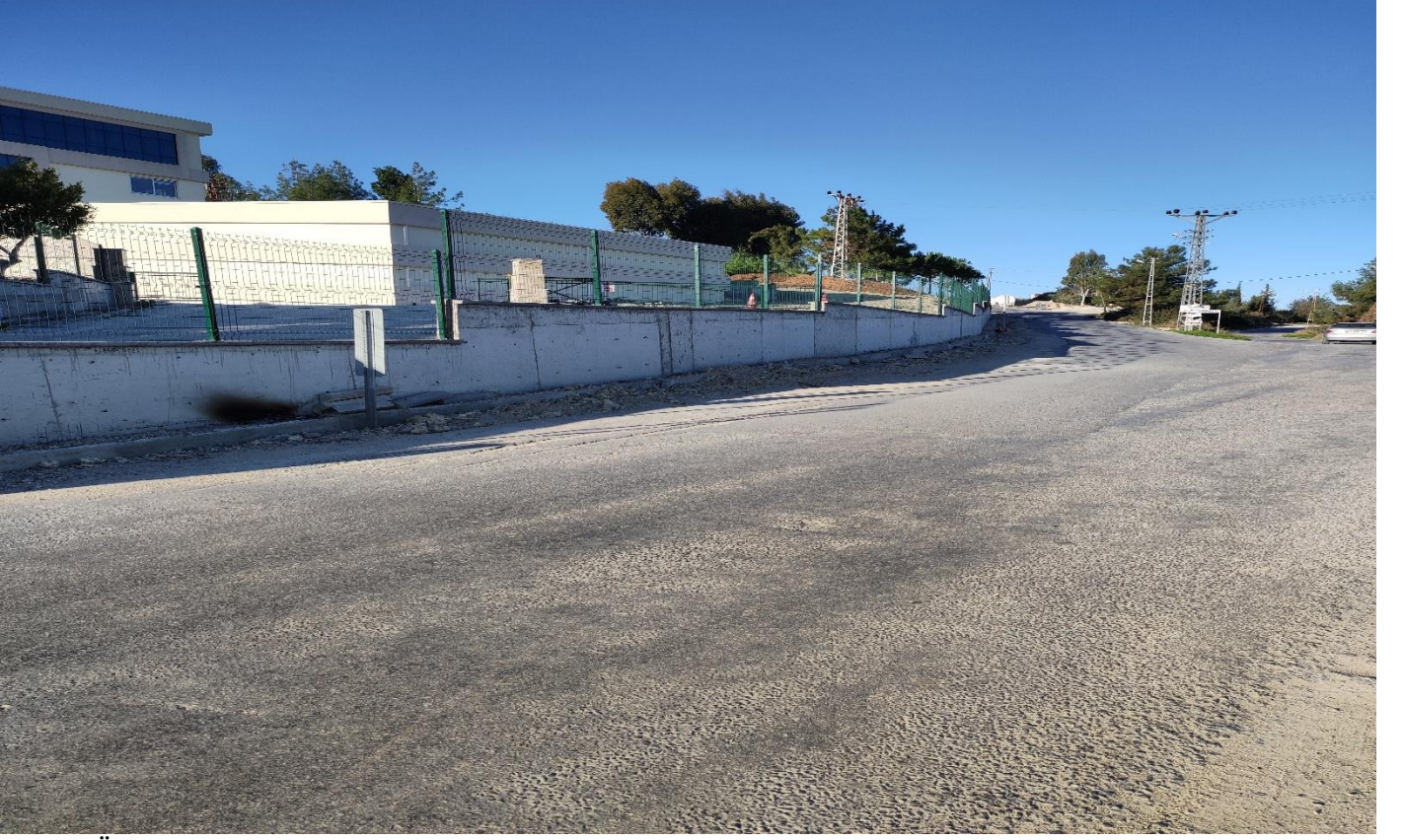
Tarsus Üniversitesi Çevre Duvarı ve Giriş Kapısı Yapılması