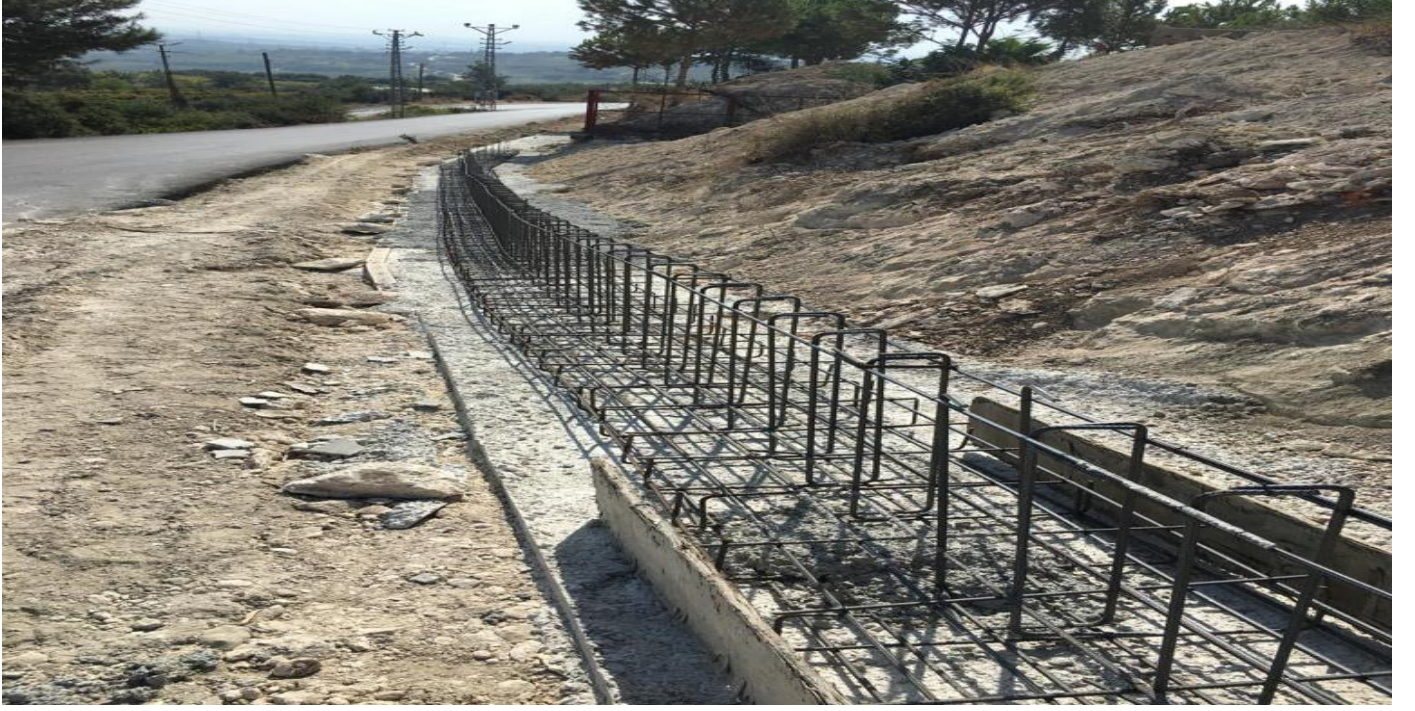
Tarsus Üniversitesi Çevre Duvarı ve Giriş Kapısı Yapılması

Üniversitemiz kuzey yerleşkesinde 27.02.2022 tarihinde yapımına başlanmış olup, 06.10.2022 tarihinde tamamlanmıştır. Tarsus Üniversitesi Çevre Duvarı ve Giriş Kapısı Yapım işinin sözleşme bedeli 976.000,00TL. Yapım işinin % 100'ü tamamlanmıştır.