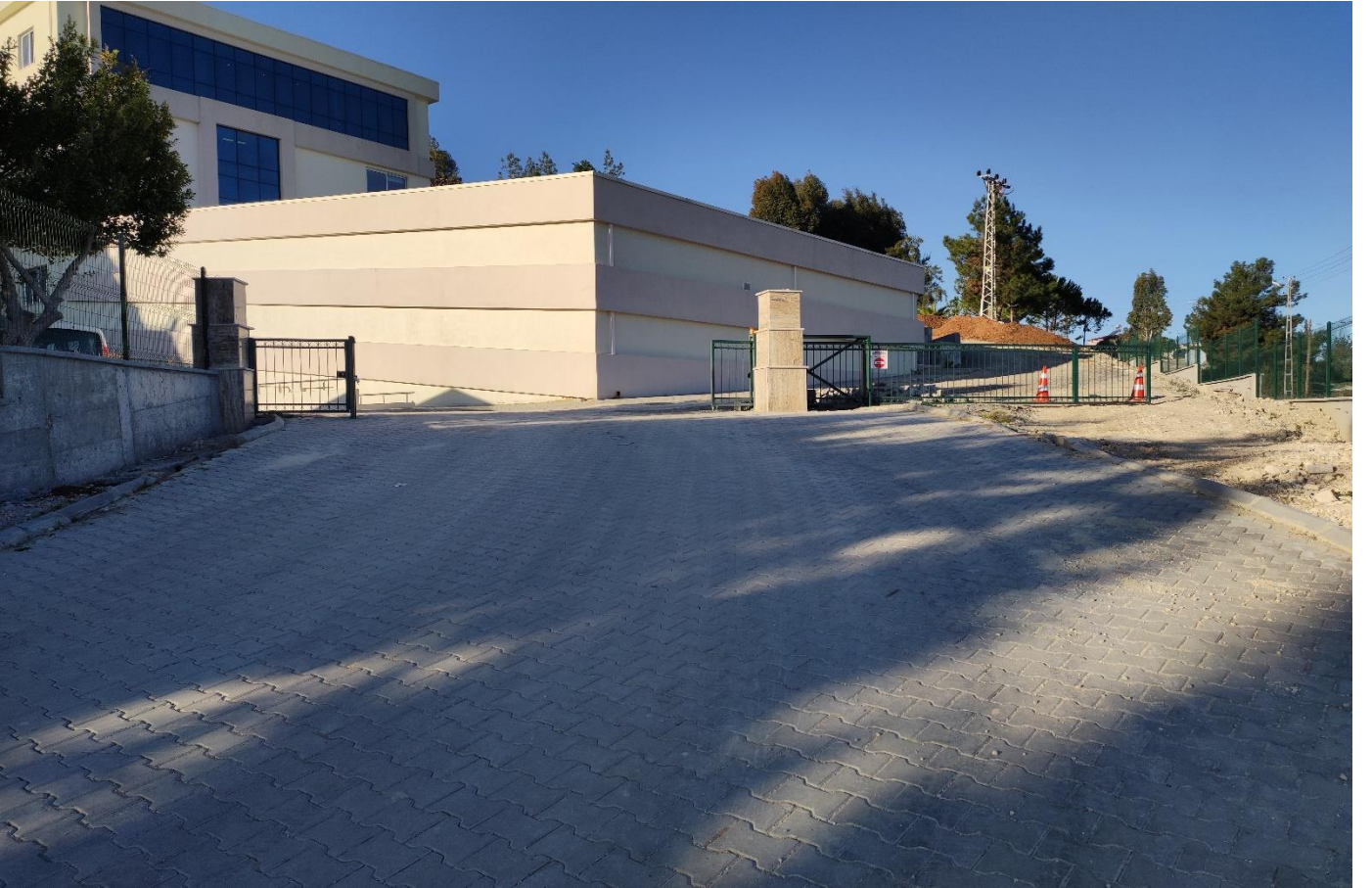
Tarsus Üniversitesi Çevre Duvarı ve Giriş Kapısı Yapılması