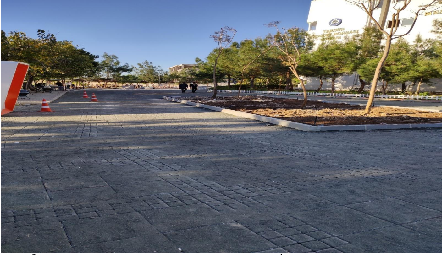
Tarsus Üniversitesi Çevre Düzenleme ve Yol Aydınlatma Yapılması İşi

Üniversitemiz kuzey yerleşkesinde 14.11.2022 tarihinde yapımına başlanan Tarsus Üniversitesi Çevre Düzenleme ve Yol Aydınlatma Yapılması İşinin sözleşme bedeli 4.747.000,00 TL. Yapım işinin % 35'i tamamlanmıştır.