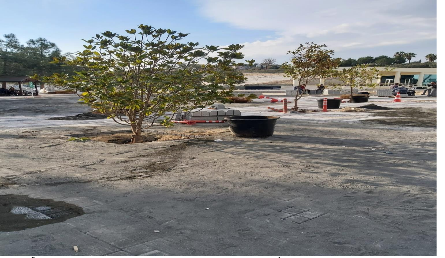
Tarsus Üniversitesi Çevre Düzenleme ve Yol Aydınlatma Yapılması İŖi