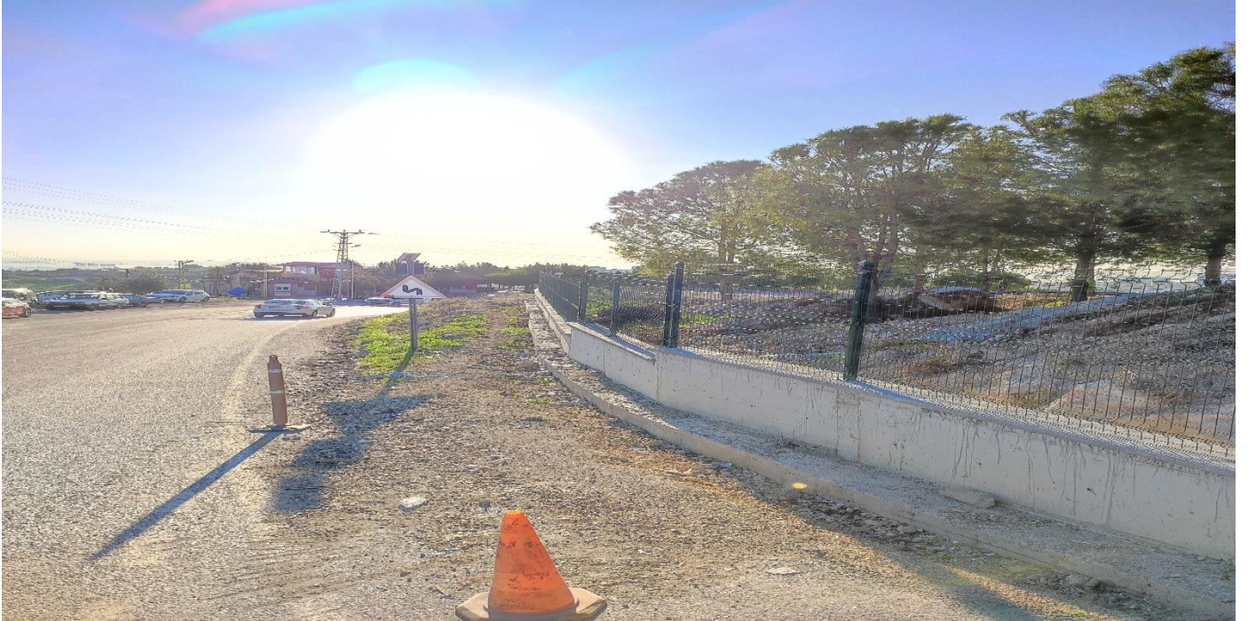
Tarsus Üniversitesi Çevre Duvarı ve Giriş Kapısı Yapılması