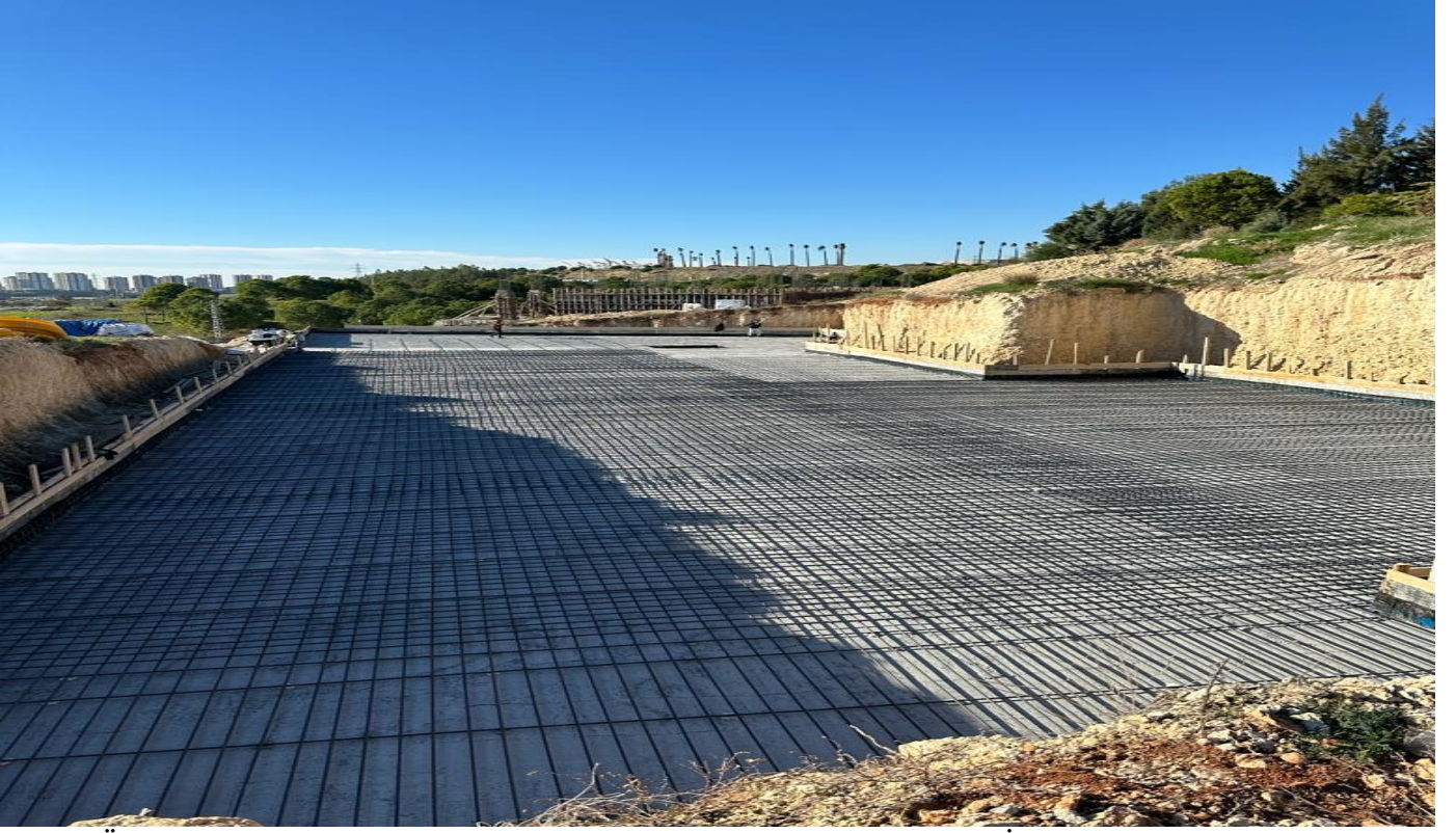
Tarsus Üniversitesi Yabancı Diller Hazırlık Sınıfları Derslik Binası Yapım İşi