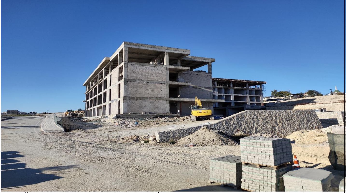
Tarsus Üniversitesi Mühendislik Fakültesi Yapım İşi