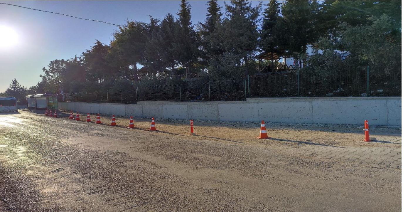
Tarsus Üniversitesi Çevre Duvarı ve Giriş Kapısı Yapılması