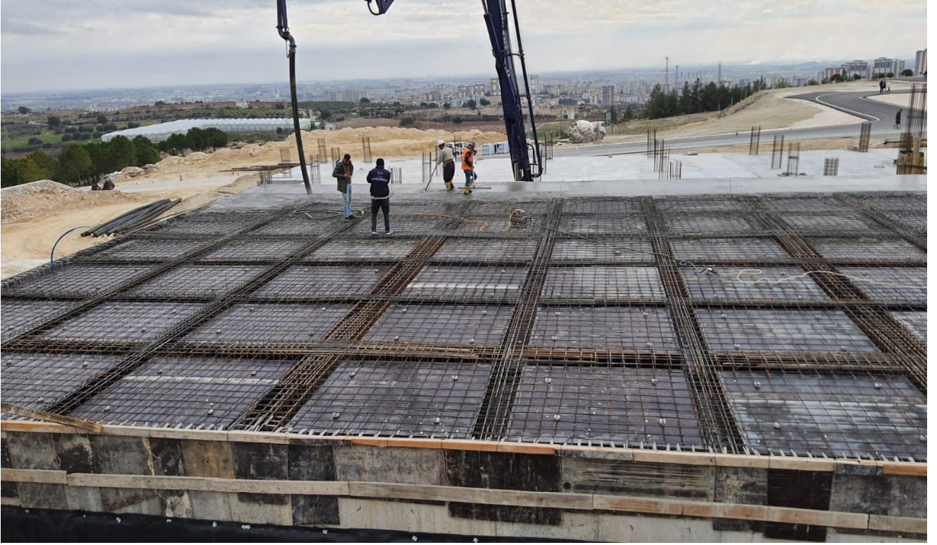
Tarsus Üniversitesi Mühendislik Fakültesi Yapım İşi

Üniversitemiz kuzey yerleşkesinde 11.08.2021 tarihinde yapımına başlanan Tarsus Üniversitesi Mühendislik Fakültesi Yapım İşinin sözleşme bedeli 23.391.500,00 TL. Yapım işinin % 63 'ü tamamlanmıştır.